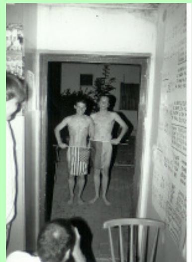
Bando mit Air Jordan

wird eine nightsession denn um 26.36 Uhr (hinderische Zeitrechnung) tauchen noch zwei weitere Gäste auf, die den Sieg der USA über Kolumbien bejubeln (Ende 3.36 Uhr; jetzt darf auch BS in's Bett). 14 von über zwanzig Gästen tippen das Spiel Italien - Norwegen, doch keiner hatte das 1:0 auf dem Zettel. Geld für Chips somit vorhanden. Fast der gesamte Hauptausschuss gibt sich die Ehre, natürlich auch 'Sir Lotus II'. Einer trinkt fünf Bier in 60 Minuten. Rekord! In der Halbzeit die Helge-Show. Es gibt schon wieder Reis!