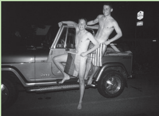
Skandal ! Knabenstrich, Konkurrenz zur Stresemannstraße ?