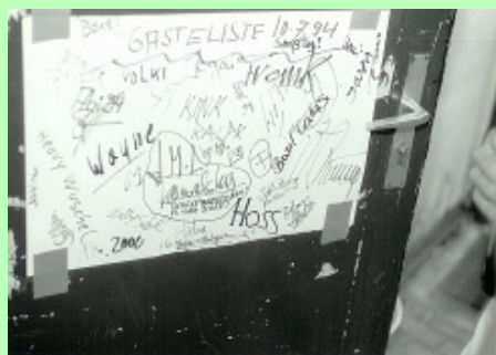
Gästeliste des 10. Juli 1994