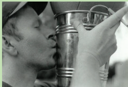
Mac Fly freut sich über seinen Basketballsieg