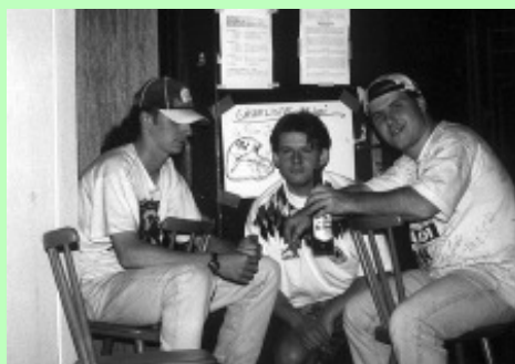
Teilnehmer von "Beschwingt in's Wochenende": King Ralph, JS, Rini

holt sich seinen vierten Übernachtungspunkt, Rini den ersten. 10.00 Uhr: Pünktlich zum ersten WM-Frühstück (Yoghurt) erscheint MC Fly und steht vor verschlossenen Türen. Also steigt er über