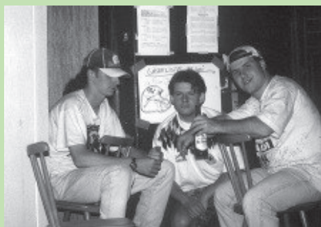
Teilnehmer von "Beschwingt in's Wochenende": King Ralph, JS, Rini

holt sich seinen vierten Übernachtungspunkt, Rini den ersten. 10.00 Uhr: Pünktlich zum ersten WM-Frühstück (Yoghurt) erscheint MC Fly und steht vor verschlossenen Türen. Also steigt er über