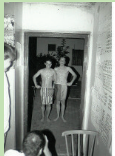
Bando mit Air Jordan

wird eine nightsession denn um 26.36 Uhr (hinderische Zeitrechnung) tauchen noch zwei weitere Gäste auf, die den Sieg der USA über Kolumbien bejubeln (Ende 3.36 Uhr; jetzt darf auch BS in's Bett). 14 von über zwanzig Gästen tippen das Spiel Italien - Norwegen, doch keiner hatte das 1:0 auf dem Zettel. Geld für Chips somit vorhanden. Fast der gesamte Hauptausschuss gibt sich die Ehre, natürlich auch 'Sir Lotus II'. Einer trinkt fünf Bier in 60 Minuten. Rekord ! In der Halbzeit die Helge-Show. Es gibt schon wieder Reis !