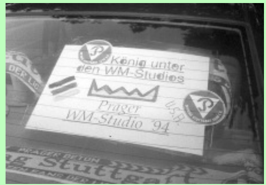
BILD berichtet über das Prager WM-Studio. "Es gibt nur einen Bregy !" Die USA holen sich gegen die Schweiz einen Punkt. Irische Nacht nach dem 1:0 gegen Italien. Jürgen

JS kauft sich eine BILD-Zeitung. 20.30 Uhr: Eröffnung des Prager WM-Studios. Der flauen Eröffnungsfeier folgt ein 1:0-Sieg Deutschlands über Bolivien. vV spendet seinen Tippspielgewinn aus freien Stücken und gibt eine Runde aus. Ein Taxifahrer steht in der Tür, fragt: Taxi?