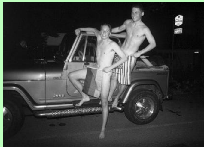
Skandal ! Knabenstrich, Konkurrenz zur Stresemannstraße ?