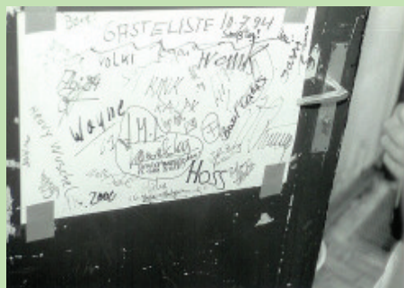
Gästeliste des 10. Juli 1994