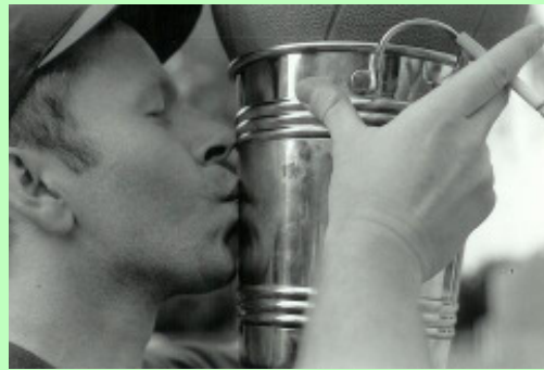
Mac Fly freut sich über seinen Basketballsieg