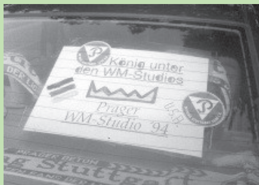
BILD berichtet über das Prager WM-Studio. "Es gibt nur einen Bregy !" Die USA holen sich gegen die Schweiz einen Punkt. Irische Nacht nach dem 1:0 gegen Italien. Jürgen

JS kauft sich eine BILD-Zeitung. 20.30 Uhr: Eröffnung des Prager WM-Studios. Der flauen Eröffnungsfeier folgt ein 1:0-Sieg Deutschlands über Bolivien. vV spendet seinen Tippspielgewinn aus freien Stücken und gibt eine Runde aus. Ein Taxifahrer steht in der Tür, fragt: Taxi?