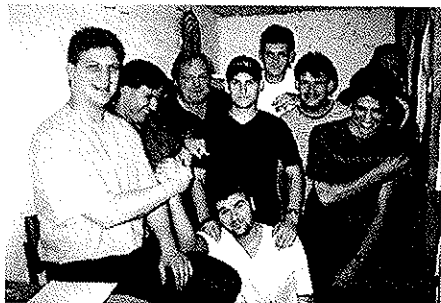
Teilnehmer Prager Dartturnier